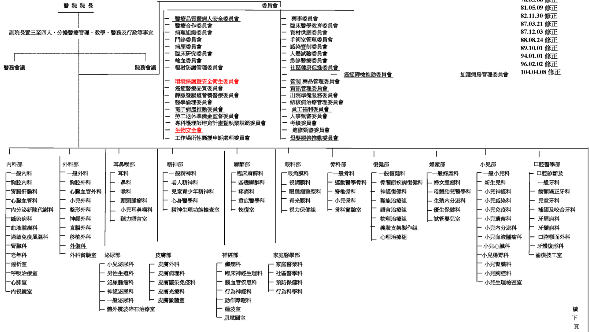
國立成功大學醫學院附設醫院組織系統表(修正草案)